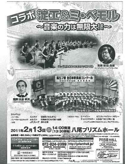
▲コラボ！淀工&ミ・ベメル ～音楽の力は無限大!!～