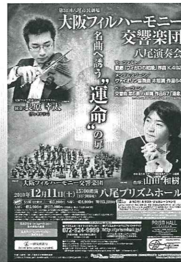
▲大阪フィルハーモニー交響楽団 八尾演奏会

八尾市と共催で、今を代表するアーティストはもちろん、ビッグネームを招き開催しています。