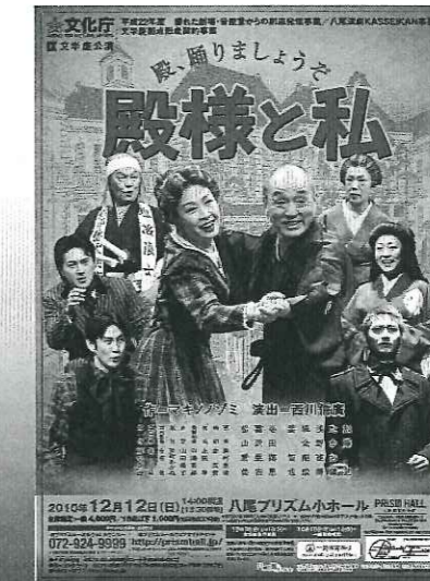
▲文学座拠点契約事業 「殿様と私」